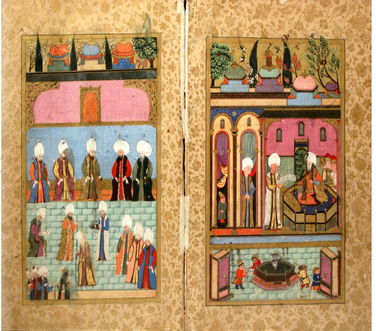
Özdemiroğlu Osman Paşa'nın İran seferlerinde serdarlığa tayin edilmesi. Âsafî Dal Mehmed Çelebi, Şecâ'at-nâme , İstanbul Üniversitesi Nadir Eserler Ktp. TY. 6043, 7b-8a.

Osman Paşa, Lala Mustafa Paşa'nın yerine yeni serdar olarak Sinan Paşa'nın atanması ile bazı sıkıntılar yaşasa da Meşale Savaşı'nda (14-18 Rebûlâhir 991/7-11 Mayıs 1583) kazandığı başarı ile Şemah'ı fethetmiştir. Bu sırada İran seferlerine asker göndermeyi reddeden II. Mehmed Giray Han (öl. 992/1584) üzerine Kefe'ye gönderilen Osman Paşa, sultanın isteği üzerine Mehmed Giray yerine II. İslam Giray'ı Kırım tahtına çıkarmıştır. Osman Paşa kısa süre sonra da Siyavuş Paşa'nın yerine veziriazam tayin edilmiştir (20 Receb 992/28 Temmuz 1584).